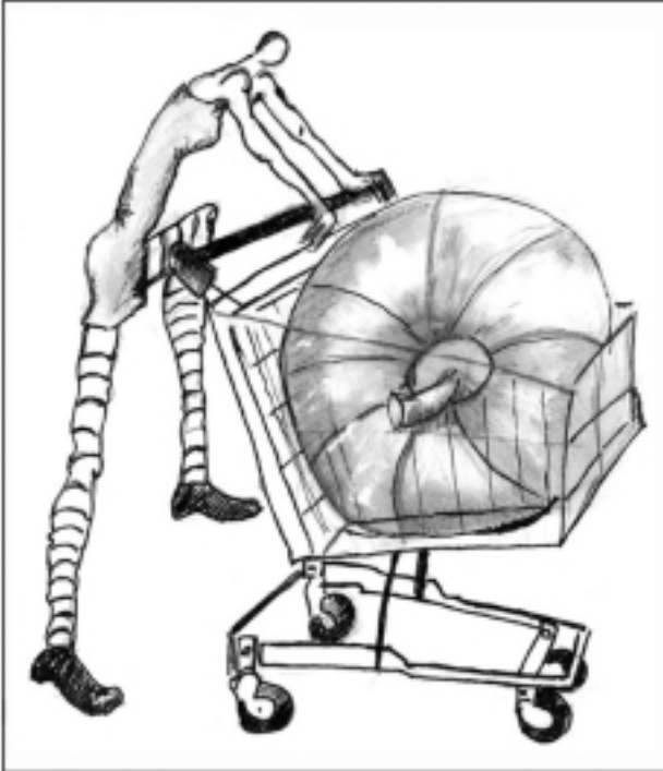
THÈME : MELON ; COUVERTURE : BLANDINE JULLIEN ; IMAGES : GABRIEL DUMOULIN, GUDULE DELLE, DOCTEUR PÉPONE ; TEXTES : PAUL FENOULT, VALE POHER, DADATHITHI, ELIX DE SANGRAL, CHRISTOPHE SÉGAS, BAAL, AFLAOUINE & METTE MARIE.